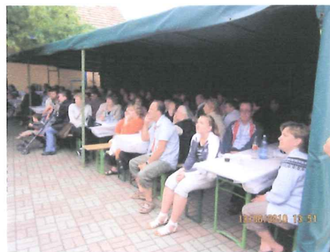
Fête de la chorale le 13 juin 2010 : beau succès !